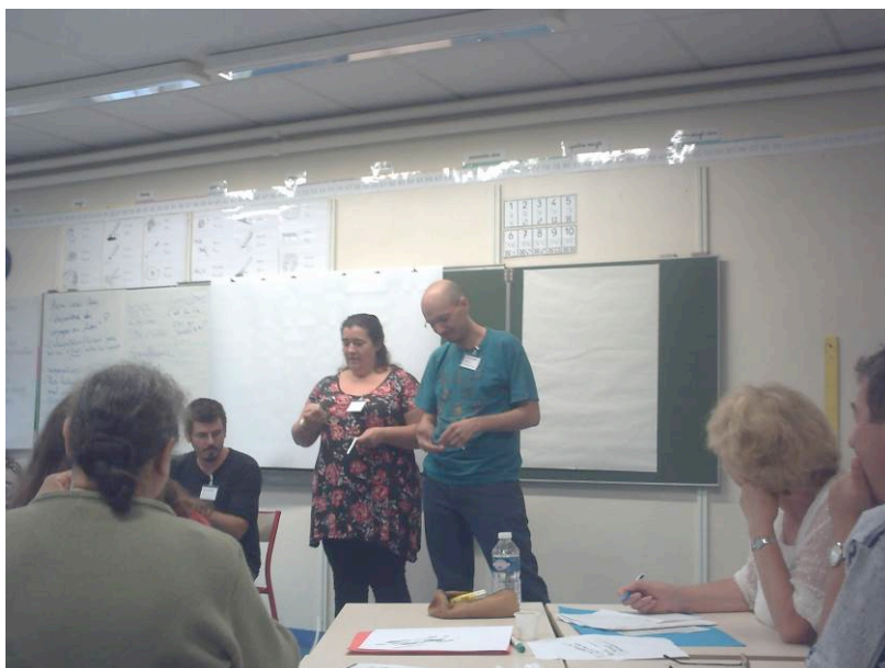
Alors... on slame...