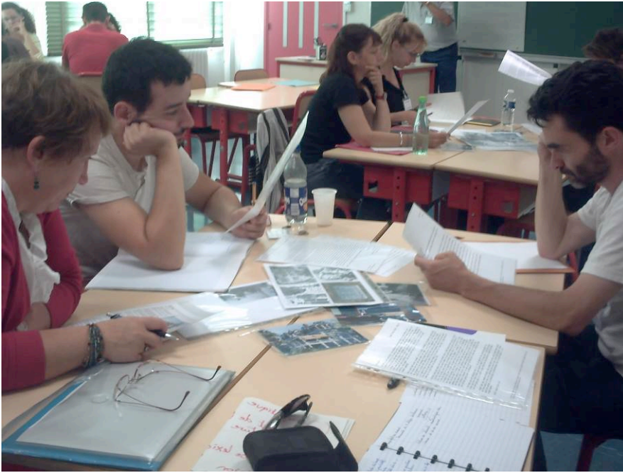
Hopper fait son cinéma