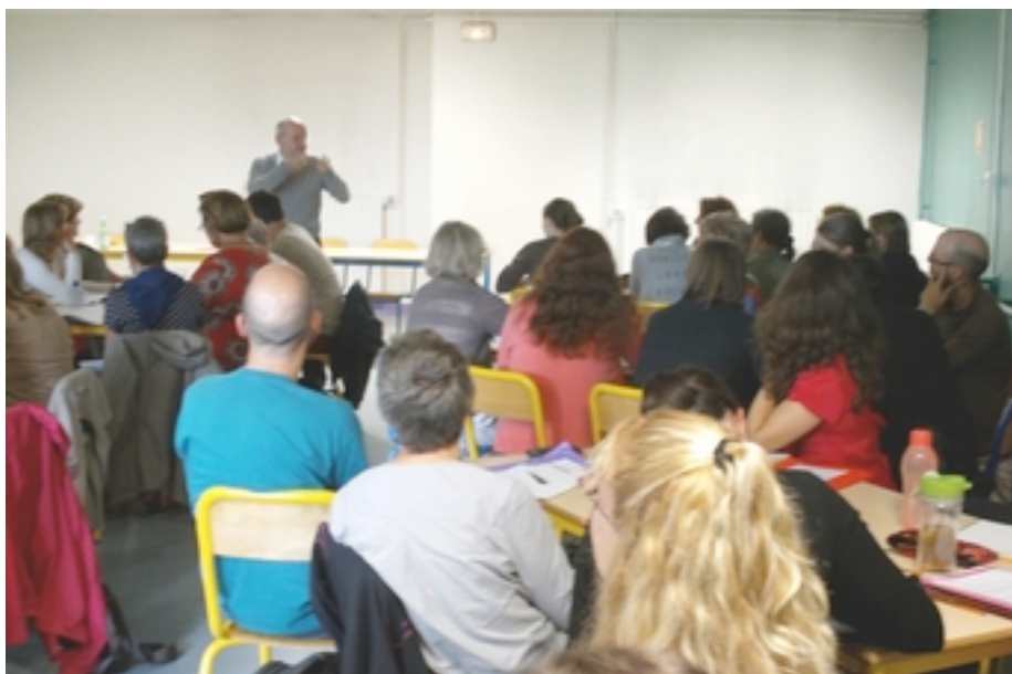
Un public attentif