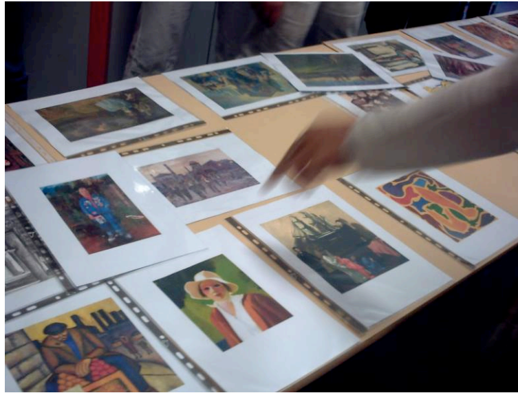
Un choix parfois difficile